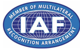
IAF-MLA/CNAS国际互认联合徽标